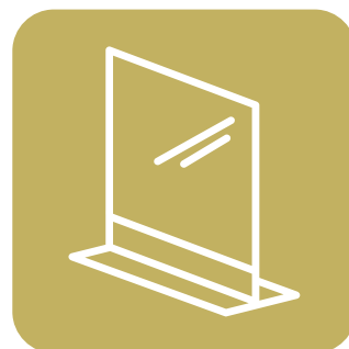
パーテーションの 設置