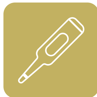
スタッフの検温・ 健康管理