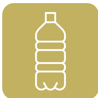
飲料はペットボトルで ご提供