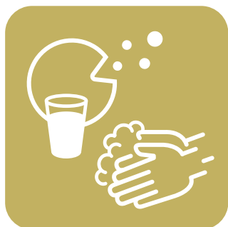
スタッフの手洗い・ うがいの徹底