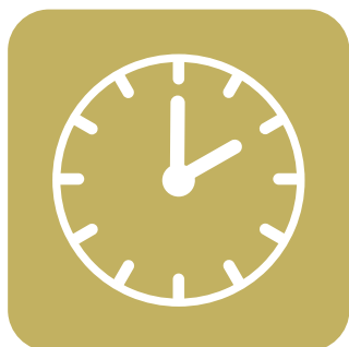
完全予約・ ご来場組数の制限