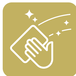
商談毎の除菌清掃