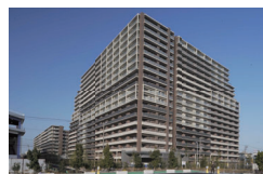
2010年2月竣工(777戸) フォレシウム