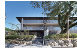
2020年8月竣工(44戸) シャリエ京都山科