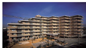
1990年2月竣工(57戸) シャリエ岸和田