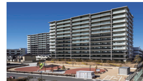
EAST 2017年3月竣工(95戸) WEST 2018年3月竣工(95戸) シャリエ長泉グランマークス