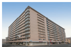
1973年7月竣工(250戸) シャルマンコーポ野江I